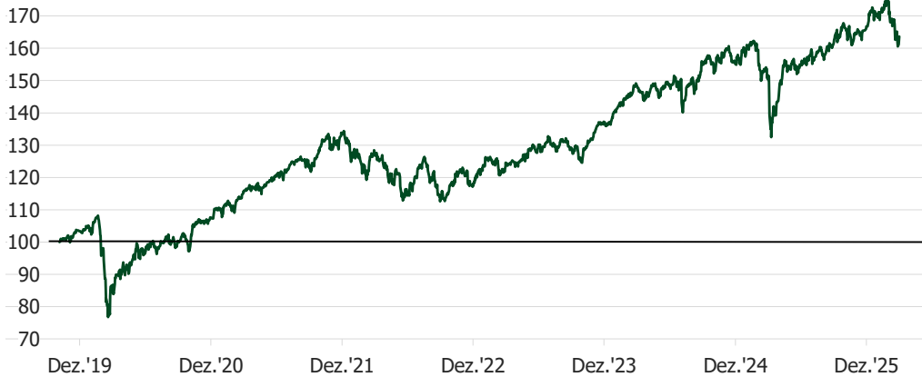
Wertentwicklung Grüne Welt 100 pur Index (nach Abzug der Kosten, s.u.)

Dargestellt ist die rückgerechnete Wertentwicklung des Finanzindex „Grüne Welt 100 pur“ seit dem operativen Start des „Grüne Welt“-Angebots am 04.11.2019. Die Wertentwicklung wurde für eine möglichst realistische Darstellung unter Abzug marktüblicher Verwaltungskosten in Höhe von 0,50% p.a. berechnet (inkl. MwSt., quartalsweise Belastung). Die innerhalb der zugehörigen ETFs entstehenden Kosten sind durch Verwendung derer Kurse automatisch berücksichtigt.