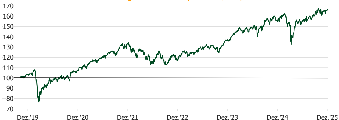
Wertentwicklung Grüne Welt 100 pur Index (nach Abzug der Kosten, s.u.)

Dargestellt ist die rückgerechnete Wertentwicklung des Finanzindex „Grüne Welt 100 pur“ seit dem operativen Start des „Grüne Welt“-Angebots am 04.11.2019. Die Wertentwicklung wurde für eine möglichst realistische Darstellung unter Abzug marktüblicher Verwaltungskosten in Höhe von 0,50% p.a. berechnet (inkl. MwSt., quartalsweise Belastung). Die innerhalb der zugehörigen ETFs entstehenden Kosten sind durch Verwendung derer Kurse automatisch berücksichtigt.